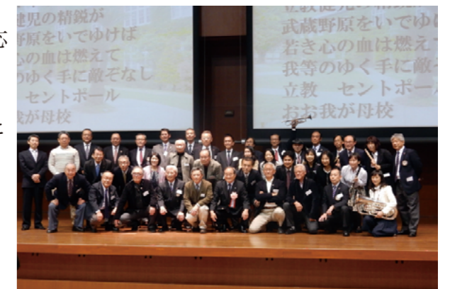
昨年の六旗会の様子