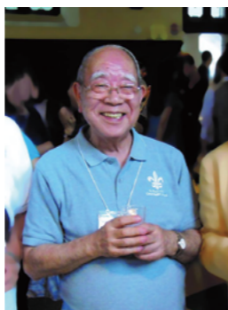
2014年9月のバンド60周年/チア40周年の時の榎本先輩 →