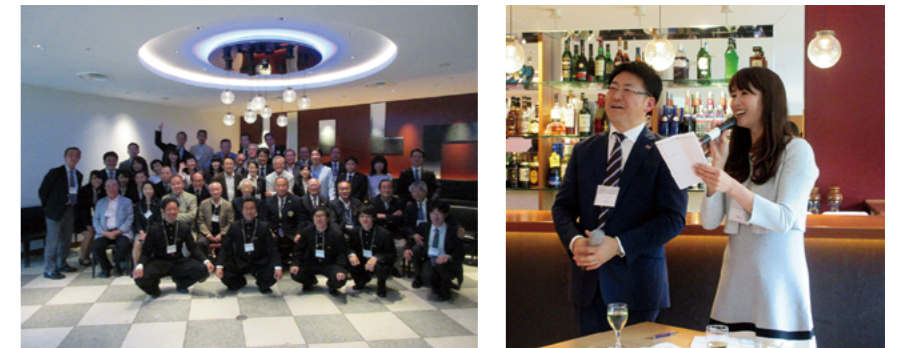
昨年の総会後の懇親会の様子